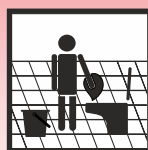
Manuelle Verarbeitung im WC-Bereich