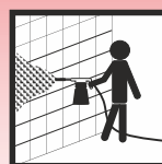
Verarbeitung in der Schaumkanone