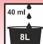
Unterhaltsreinigung: Verdünnung von 1:200