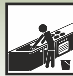
Gıda sektörü için de uygundur