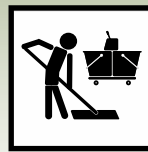
Yüzey dezenfeksiyonunda kullanılmalıdır