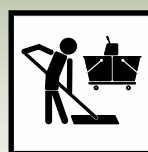
Применять для дезинфекции поверхностей