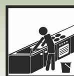
Подходит для объектов пищевой промышленности