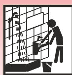
Manuelle Verarbeitung im Sanitärbereich