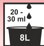
Unterhaltsreinigung: Verdünnung von 1:200 - 1:266