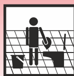
Manuelle Verarbeitung im WC-Bereich