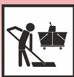
Manuelle Verarbeitung im Wischverfahren