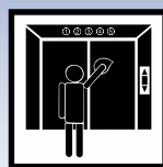
Verarbeitung auf Edel- stahloberflächen, wie z. B. Aufzugskabinen