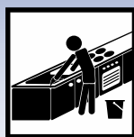
Manuelle Verarbeitung in der Küche