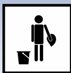
Manuelle Verarbeitung mit dem Tuch

Die hierin enthaltenen Informationen und Empfehlungen entsprechen zum Zeitpunkt der Veröffentlichung unserem besten Wissen und Kenntnisstand. Es liegt in der Verantwortung des Benutzers, sicherzustellen, dass das Produkt für die beabsichtigte Anwendung geeignet ist.